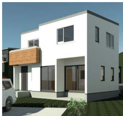
(戸建2階建てタイプの例)